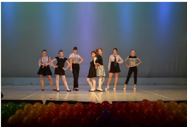
Участие в Международном конкурсе детского художественного творчества «Праздник детства», г. Санкт-Петербург