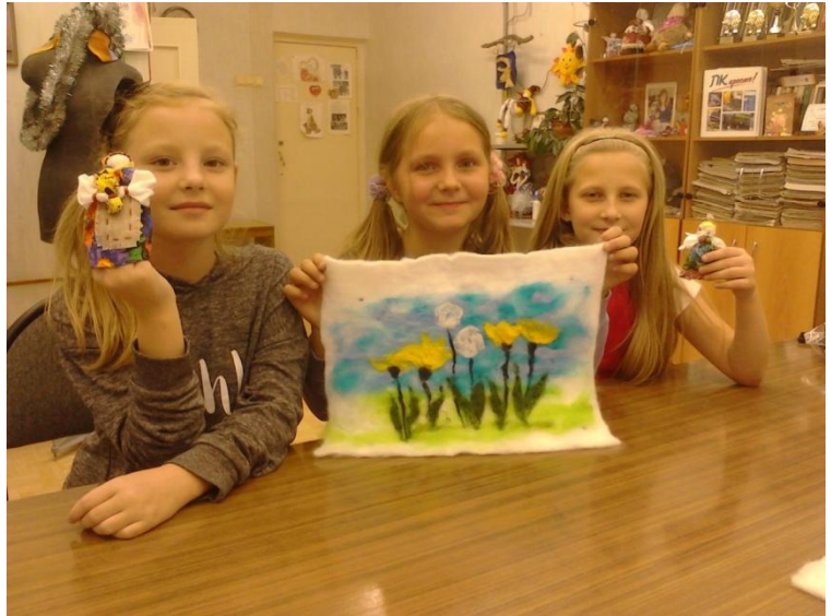
Декоративно-прикладное творчество. Техника «художественный войлок».