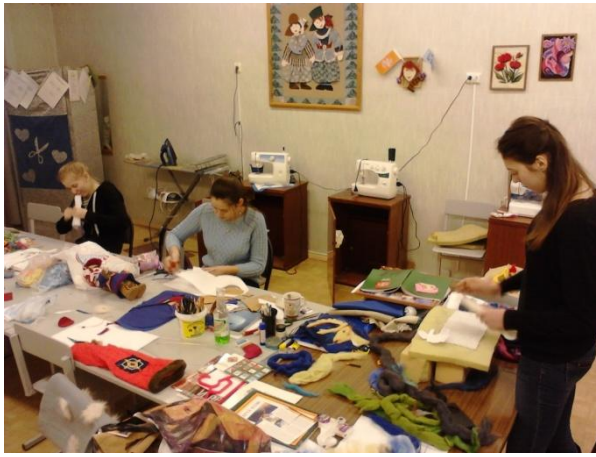
Работа над изделиями.