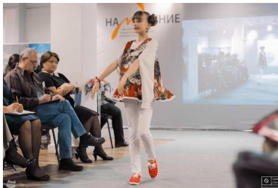
Участие в Открытом фестивале молодых художников-модельеров, дизайнеров одежды «НаМОДнение – 2016»